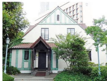
聖路加国際病院 トイスラー記念館