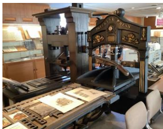
ミズノプリンティング ミュージアム