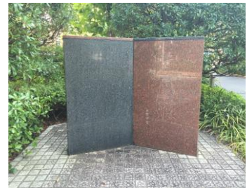
蘭学事始めの地 解体新書